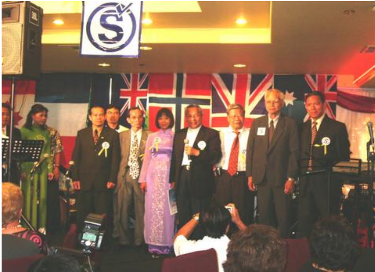
Ban Điều Hành PTSG trình diện trong ĐHTG 2006 PTSG - ĐHTG2007